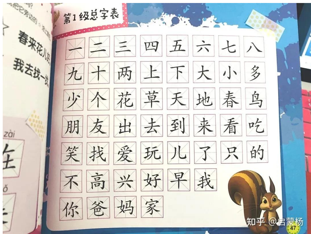
《迪斯尼我会自己读》 Level 1 vocabulary