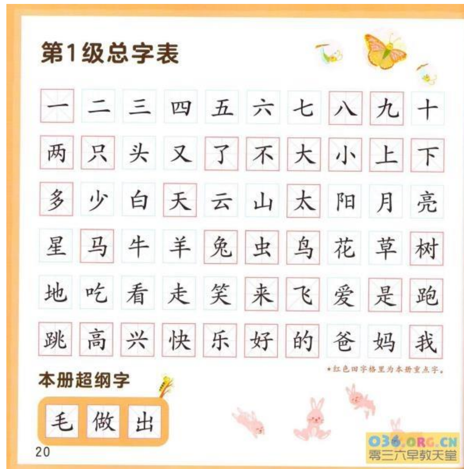
《小羊上山》 Level 1 vocabulary

Graded Readers for native Chinese speakers